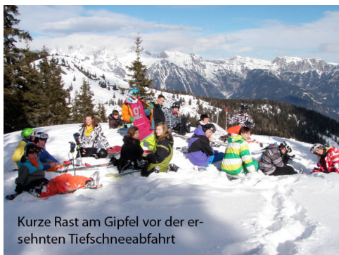
Kurze Rast am Gipfel vor der ersehnten Tiefschneeabfahrt